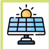
ソーラー充電 搭載